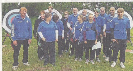
Die erfolgreichen Teilnehmer der Bezirksmeisterschaft.